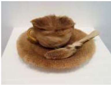
Meret Oppenheim "Le déjeuner en fourrure " (1936) 10,9 x 7,3 cm Musée d'art moderne de New York