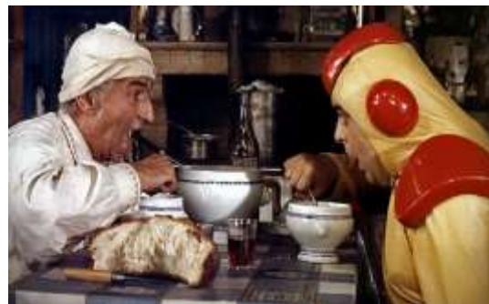
La Soupe aux choux film Jean Girault 1981