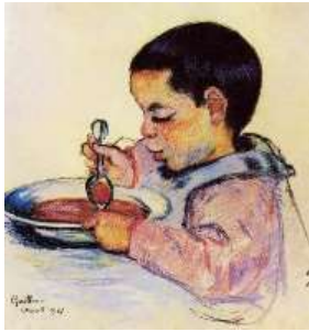
Armand GUILLAUMIN Paris, 1841 1927. L'enfant mangeant sa soupe 1896? Lithographie en couleur