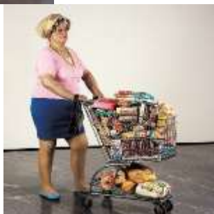
Duane Hanson 1969 Supermarket Lady (ou Caddie) Dimensions : grandeur nature (166 cm de hauteur) Fibre de verre, résine de polyester Lieu de conservation : Ludwig forum, Aix-la-Chapelle