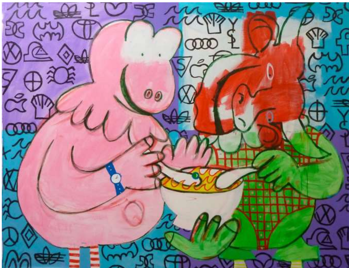
Cristof Dènmont « L'heure de la soupe » Peinture acrylique Dimensions 250 x 200 cm Année de création 2012 Collection FRAC Région Réunion