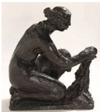
PIERRE-AUGUSTE RENOIR 1916. Bronze. 26 x 23 x 13 cm.