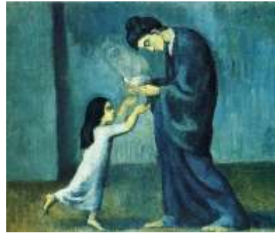
Pablo Picasso 1902-03, La Soupe, huile sur toile, 38,5 x 46,0 cm, Toronto, Canada.