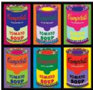
Andy Warhol, "Campbell's Soup Cans" (1962), Acrylique et liquitex en sérigraphie sur toile