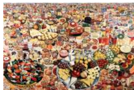
Erro Foodscape 1964