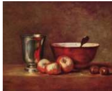
Jean Siméon Chardin Nature morte (vers 1760), Paris, musée du Louvre